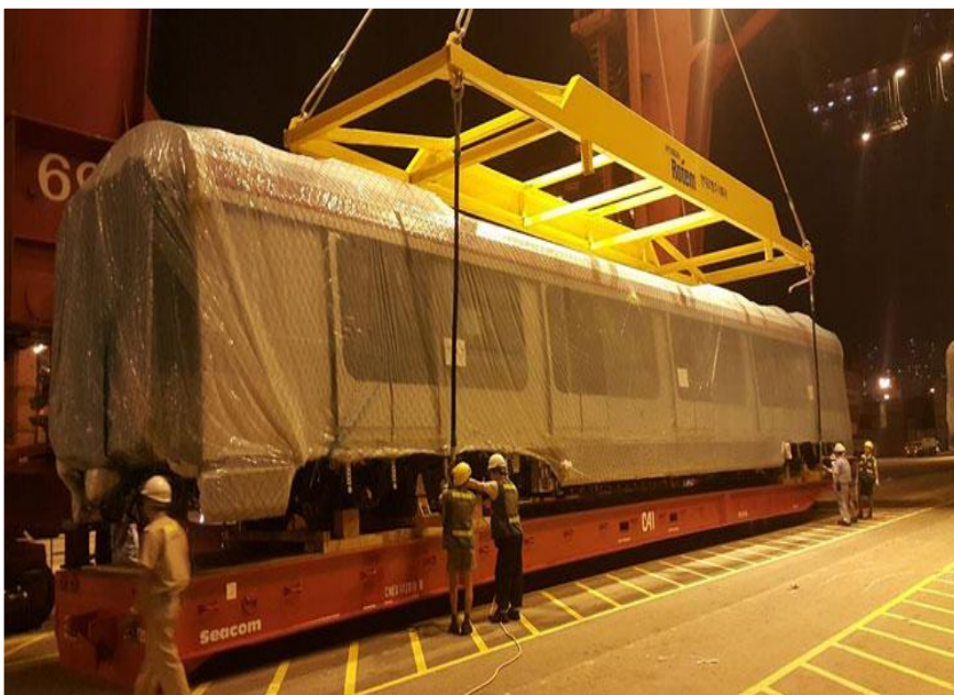
被包封着的沙中線新列車，由水路運到青衣貨櫃碼頭，工程人員協助運送。(「商用車大本營會員」fb)