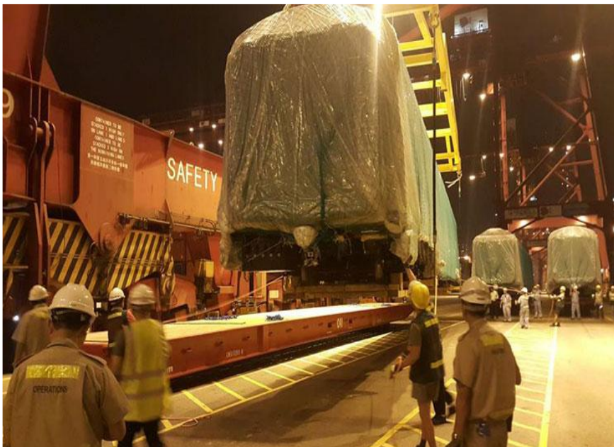
沙中線新列車昨晚運抵本港，多名工程人員協助運送。